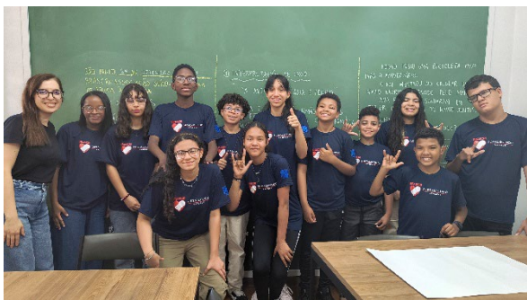
Klassenfoto der neu gegründeten Förderklasse

2025 umfasste das Projekt zwei sozialpädagogische Angebote: das frühkindliche Tagesangebot für gehörlose Kinder im Alter von zwei bis sechs Jahren sowie das neue Angebot «Fortalecendo Saberes» für Kinder und Jugendliche von sechs bis fünfzehn Jahren, das im März startete. Die älteren Teilnehmenden besuchen die Regelschule und erhalten bei BRASCRI an zwei Halbtagen pro Woche ergänzende Förderung. Beide Angebote entwickelten sich im Berichtsjahr stabil. Das neue Programm ergänzte die bestehende Frühförderung sinnvoll.