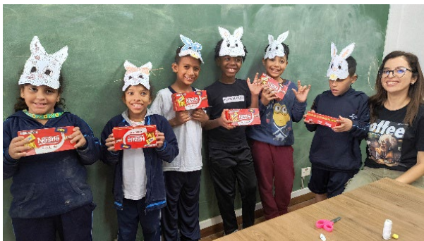
Die Gruppe der Kleinkinder feiert Ostern

Am «Tag der indigenen Völker» erfuhren sie mehr über Brasiliens indigene Kulturen und gestalteten eigene Tongefäße. Es war eine kreative Auseinandersetzung mit kultureller Vielfalt.