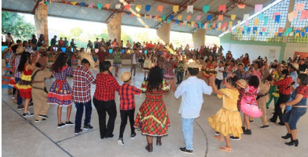
Kinder tanzen am Fest "Festa de São João" Folkloretänze

Alle 95 Kinder und Jugendlichen präsentierten Folkloretänze des brasilianischen Nordostens. Eltern, Familien und Mitwirkende aus der Stadt Santa Rita nahmen teil und erlebten die Tanz- und Theaterkultur der Region hautnah.