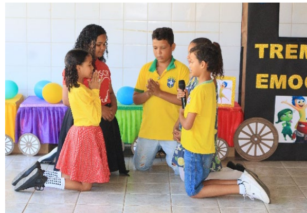
Kinder im Projekt "Trem das Emoções"

Im Mai fand in der Kindertagesstätte José Candido Feitosa die erste Etappe des «Zugs der Gefühle» statt, mit einem Musical und dem Theaterstück «O ladrão da alegria» («Der Dieb der Freude»).