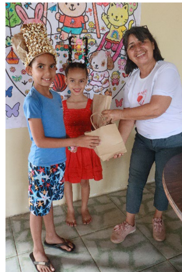
Ein Foto aus der "Kinderwoche"

Zudem fand die «Kinderwoche» mit thematischen Tagen und einem grossen Abschlussfest im Sporthaus Amaro Gomes statt.