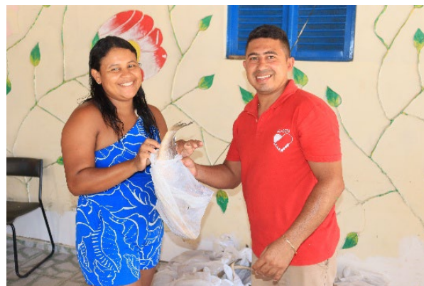
Übergabe des Fisches an eine Familie

«Paixão de Cristo: Amor Incondicional» («Leiden Christi: Bedingungslose Liebe») auf.