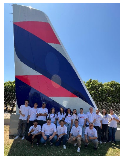
Besuch im Flugzeugwartungszentrum