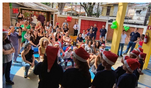
Jährliche Weihnachtsfeier bei BRASCRI in der Casa Sofia

Zum Jahresende feierte BRASCRI die alljährliche inklusive Weihnachtsfeier. Kinder, Eltern und das Team kamen zusammen, erhielten Geschenke vom Weihnachtsmann und blickten auf ein erfolgreiches Jahr zurück.