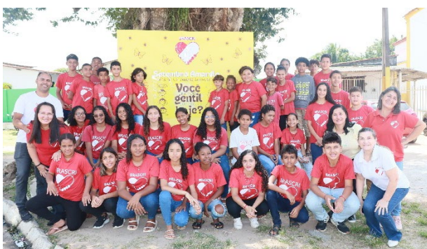
Mitwirkung an der Suizidpräventionskampagne

Im September beteiligte sich das Projekt an der Suizidpräventionskampagne «Setembro Amarelo» mit einem Vortrag und einer Flyer-Aktion auf den Strassen.