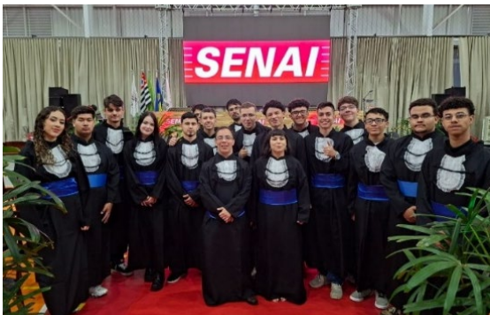
Abschlussfeier der Luftfahrtmechanik:innen