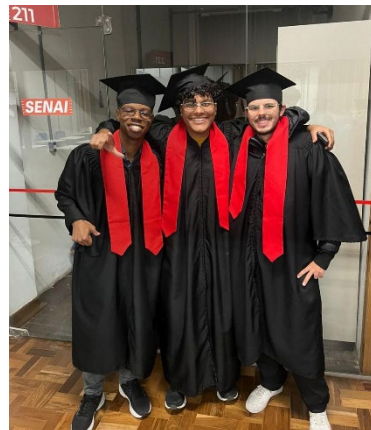
3 erfolgreiche Absolventen des Projekts

Die Mutter eines Teilnehmers schrieb dem Projektteam, dass der von Nova Chance finanzierte Transport- und Verpflegungszuschuss, ermöglicht durch Spendengelder, für ihre Familie lebenswichtig ist: Nur so kann ihr Sohn täglich zur Schule pendeln, obwohl der Vater arbeitslos ist. «Ihre Unterstützung gibt uns Hoffnung und hält den Traum meines Sohnes am Leben.»