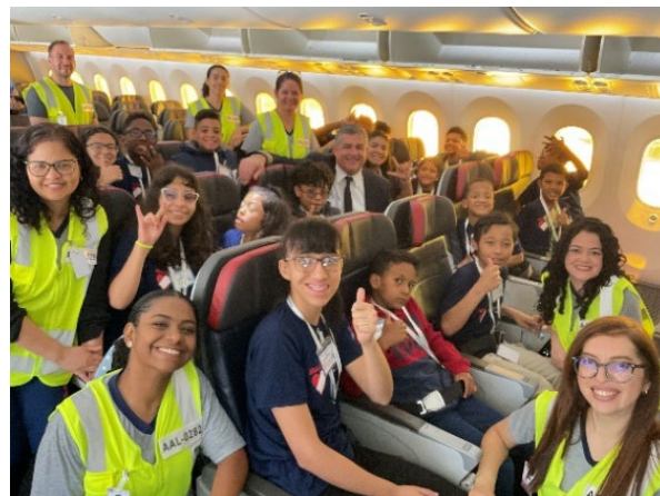
Kinder im Flugzeug der American Airlines

Im November ermöglichte die American Airlines einen unvergesslichen Ausflug: Die Kinder der Förderklasse besuchten den Flughafen Guarulhos, erkundeten ein Flugzeug von innen und stellten viele Fragen. Es war ein Erlebnis, das Horizonte erweiterte und neue Berufswünsche weckte.