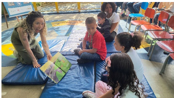
Kinder an der Märchenerzählstunde

Ein besonderes Highlight war die zweisprachige Märchenstunde mit einer gehörlosen Erzählerin, die ein Märchen in LIBRAS und schriftlichem Portugiesisch vortrug. Die Veranstaltung zeigte gelebte Inklusion.